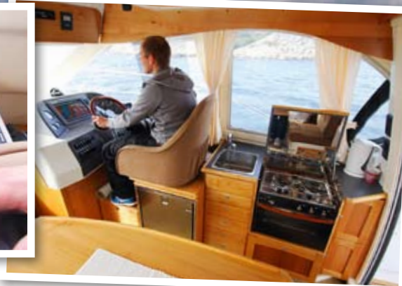
LITT GAMMELDAGS: Selve layoutløsningen i salongen er noe gammeldags synes vi. Her kunne man kanskje fått til en bedre sitteløsning for både fører og mannskap.

ganske langt ned. Dette har jeg snakket med Viksund om, og de vil vurdere en seteløsning for å kompensere for dette. På grunn av rattets stilling og førerplassen generelt hadde jeg også problemer med å se plotteren som ligger skrått foran meg i instrumentpanelet. Jeg mener at alle som bygger båter i dag, gjør en stor feil ved å legge plotteren midt i panelet. Ut til siden er mye bedre, for på den måten tar man ikke konsentrasjonen bort for skipperen, som alltid skal stole på det han ser og observerer med øynene. Plotteren skal være en kartstøtte og ikke en stor lysende firkant rett i siktlinjen. Enda