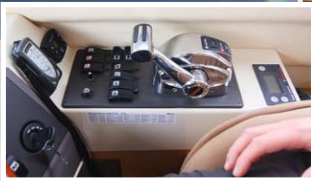
OVERSIKTLIG: Håndkontroller og trykknapper som involverer styringen av båten er samlet i en grei ergonomisk løsning.