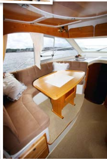
KRAFTIGE SAKER: En slankere design ville vel kanskje gitt plass til en løsning med salong og seter som kunne vendes i kjøreretningen.

Viksund 335 St Cruz fremstår på mange måter som en helt ny båt. Mye er gjort for å gjøre båten mindre stutt. Blant annet er innerlinerer ny, og badeplattformen er ikke lenger integrert i skroget. Layouten på flybriden er også gjort noe om. Til sammen oppnår derfor produsenten en båt som både virker lengre og lavere. Forandringene har også gjort sitt til at man vinner mye plass på akterdekket, og